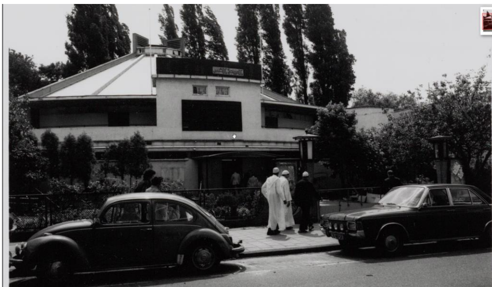
Cinetol en Moskee Al Kabir